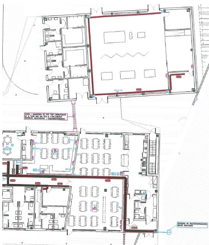
Planta baixa dreta

El cost hauria de ser el mínim possible, actualment el Departament d'Ensenyament no ha concretat la dotació d'aquest any. Es disposa d'una inversió per part de l'AFA per millorar l'equipament actual.