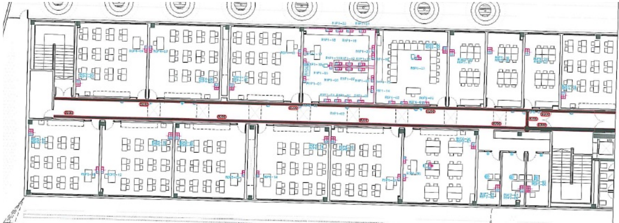
Planta primera esquerra