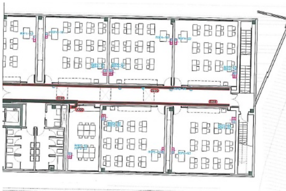
Planta primeira dreta